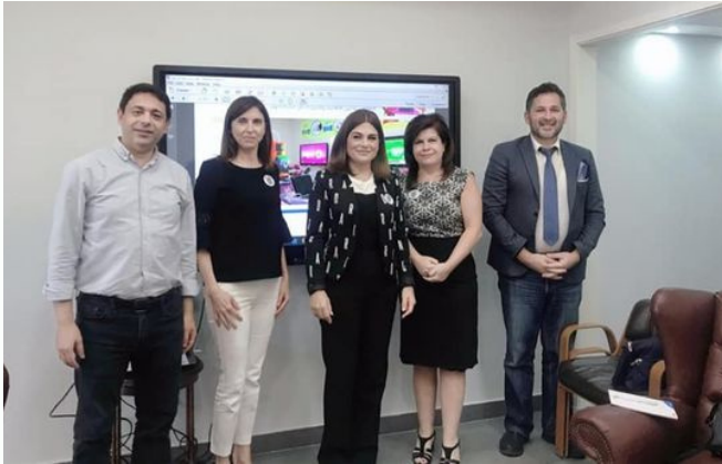
مع رئيسة جمعية WOMAN في لبنان السيدة مي واكيم