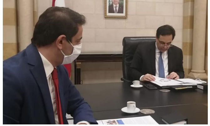
مع دولة رئيس حكومة تصريف الأعمال الدكتور حسان دياب