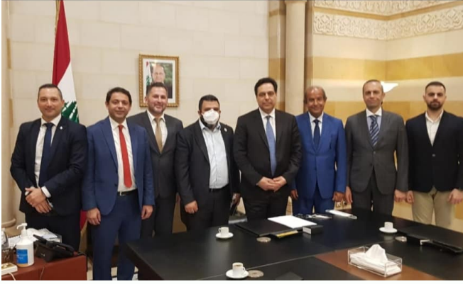
مع دولة رئيس حكومة تصريف الأعمال الدكتور حسان دياب

قامت جمعية سند لبنان بسلسلة من اللقاءات على المسؤولين والفعاليات التربوية، بهدف عرض برنامجها لدعم المدرسة الرسمية في ظل الأوضاع الاقتصادية الراهنة التي تمر بها البلاد. وقد لاقى الخطة التي أعدتها الجمعية كل التقدير والثناء والدعم، على أمل التمكن من تنفيذ جميع بنودها في المراحل المستقبلية