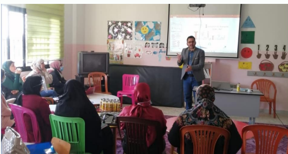
التدريب في ابتدائية كفرا الرسمية