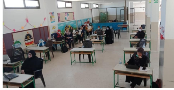
التدريب في مدرسة قلاوي الرسمية