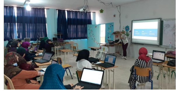
التدريب في مدرسة ياطر الرسمية