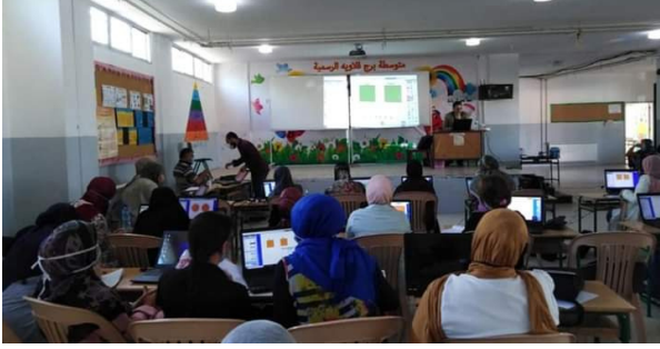
التدريب في مدرسة برج قلاويه الرسمية