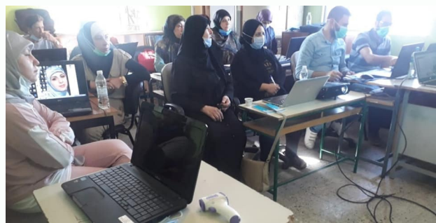
التدريب في متوسطة الجمجمة/صفد الرسمية