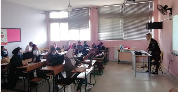
التدريب في مدرسة كفر دونين الرسمية