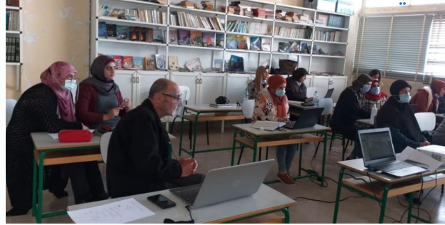
التدريب في متوسطة حاريس الرسمية