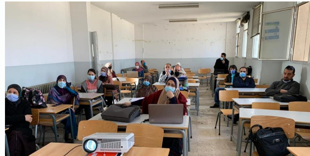
التدريب في ثانوية كفرا الرسمية